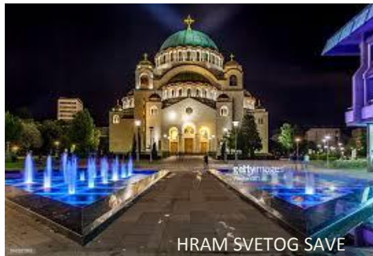
HRAM SVETOG SAVE