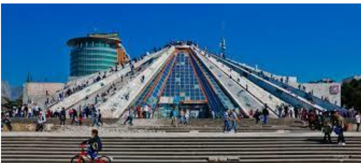
Albanija zemlja orlova