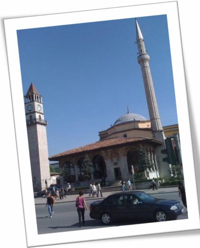
TIRANA- MODERNA I TRADICIONALNA

Ethembegova džamija je najpoznatija turisti ka atrakcija Tirane. Njenu gradnju zapo eo je 1789. beg Mola, a završio je 1821. godine njegov sin Hadži Ethem beg. Ethem je bio praunuk Sulejmana Paše, osniva a Tirane.