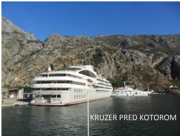
KRUZER PRED KOTOROM