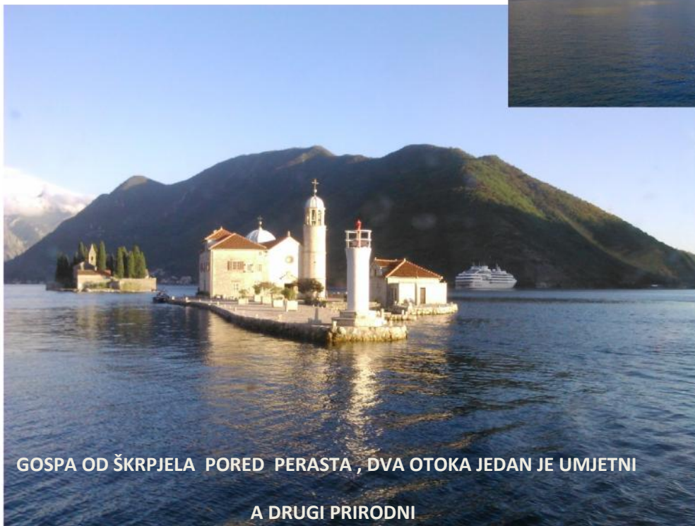
GOSPA OD ŠKRPJELA PORED PERASTA , DVA OTOKA JEDAN JE UMJETNI A DRUGI PRIRODNI