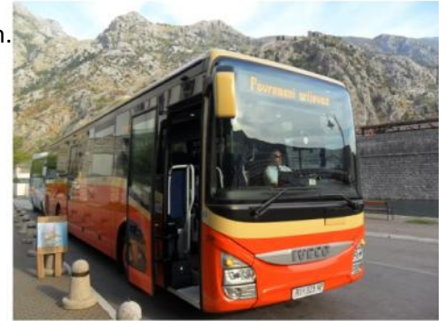
NAŠ AUTOBUS ISPRED ZIDINA KOTORA

KOTOR je stari crnogorski primorski grad i pitoreskna mediteranska luka u zalivu Boka kotorska. Stara mediteranska luka , okružena gradskim zidinama je vrlo dobro očuvana i pod zaštitom je UNESCO-a Prvi poznati naziv Kotora bio je Ascruvium.